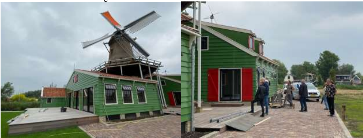
Molen De Veldmuis in Westzaan

Naast het woonwijkje waarin 16 koopwoningen en 16 huurwoningen worden gerealiseerd wil Woningstichting/Helder Vastgoed BV in de zijbeuken van de molenshuur (sociale) huurwoningen realiseren. Dit vanzelfsprekend zonder de functie van de molen te bedreigen. Maar wat voor molen moet er komen, een nieuwe of een tweedehands die opnieuw opgebouwd wordt? Een delegatie van Woningstichting/Helder Vastgoed BV, gemeente, aannemer (Ult v/d Wal), architectenbureau KJK en vanzelfsprekend de Helderse Molenstichting bezochten vrijdag 25 juni jl. daarom twee nieuwgebouwde molens. In Westzaan staat een prachtige, gloednieuwe molen met in de molenshuur een woonhuis genaamd De Veldmuis.