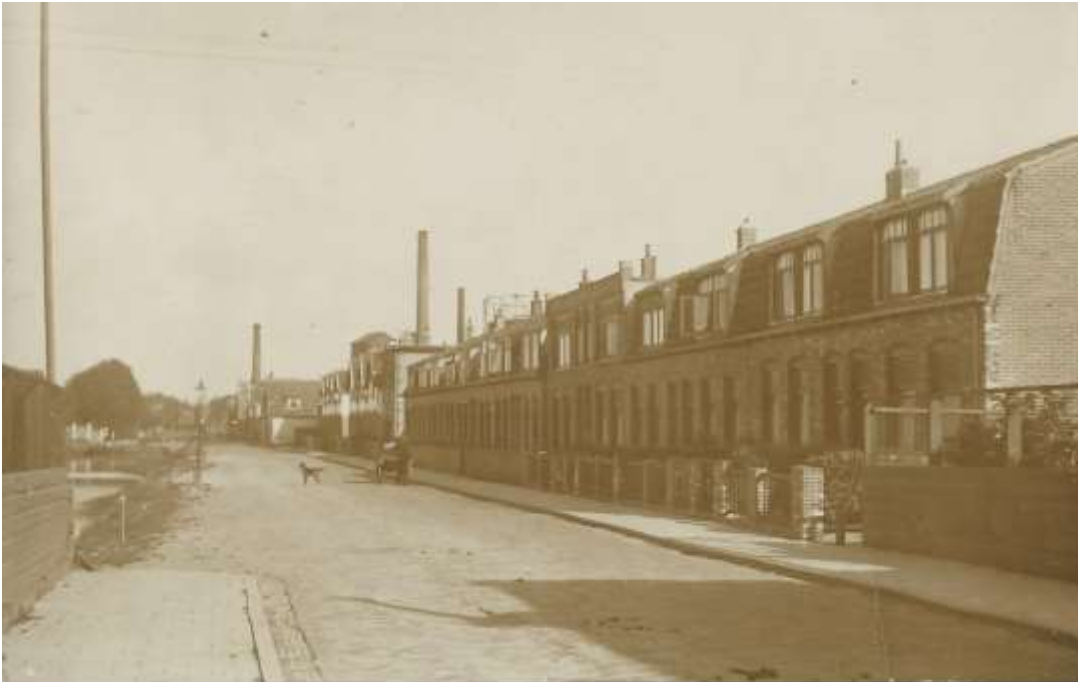
De Fabrieksgracht in oude luister. Links nog net te zien het water bij het Vinkenterrein.

In deze nieuwsbrief gaan we verder met de rubriek “Blik op het verleden van de Sluisdijkbuurt”. We nemen u mee aan de hand van oude foto’s van het Vinkenterrein maar ook van de Sluisdijkbuurt / Visbuurt. De tijd dat de Fabrieks- en Steengracht nog daadwerkelijk grachten waren en dat in de Sluisdijkstraat nog veel winkels waren gevestigd.