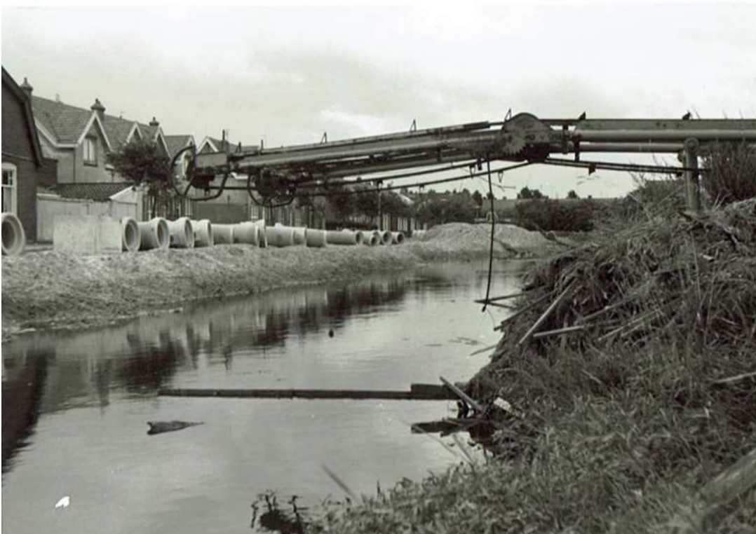
De Fabrieksgracht nog niet gedempt